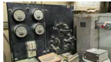
▲当時初の画期的な電気窯

七世は枚方の窯の近くが住宅地として開発される中、煙を排出しない電気窯を地元の電気業者と開発し、昭和34年には完成させていました。「当時、電気窯は珍しく、京都市からも視察が来ていた」と九世は振り返っています。