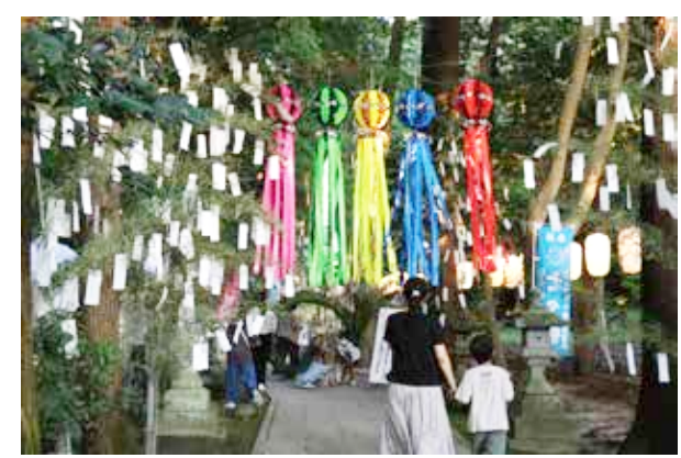
すべての応募作品が星田妙見宮の参道に飾られます

国から、3817通の応募がありました。おかげさまで、徐々に「星の俳句コンテスト」も地域内外に浸透してきたように思います。 第5回となる来年、「星の俳句コンテスト」を通じて、日本や世界に向けていっそう交野ヶ原の魅力を発信してまいります。