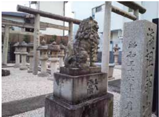
▲流祖邸跡は都山流尺八楽会により管理されている。▲住宅街の一角にある流祖都山邸跡には全国の弟子たちから寄進された鳥居や狛犬、灯籠が立ち並ぶ。